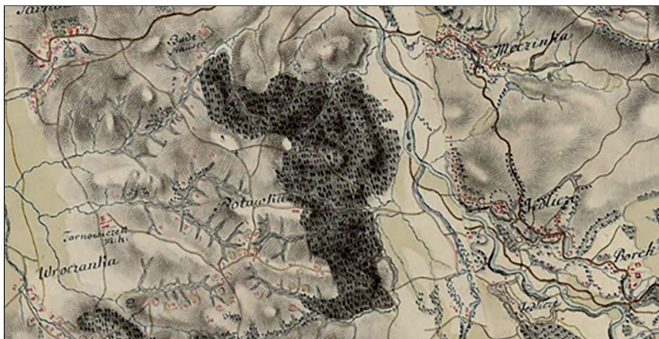
Wieś Potakówka na mapie Miega z lat 1779–1783.

Na mapie wieś Potakówka przedstawiona jest na jednej sekcji nr 77. Zaznaczono jeden raz nazwę tejże wsi błędnie jako Potawka . Miejscowość położona była na wzgórzach, otoczona z południa i wschodu przez gęsty las mieszany. Na mapie zaznaczono 61 domów w kolorze czerwonym. Wszystkie zabudowania były drewniane. Jedno z nich, największe (karczma?) stoi samotnie przy drodze do Jedlicza. Reszta domów była rozrzucana na stokach czterech pagórków, z których spływały potoki. Największe zagęszczenie zabudowy było w centralnej części wsi pośród wzgórz oraz na południowym stoku pagórka pomiędzy lasem a Wrocanką. Były one otoczone kolorem zielonym (ogrody?) z namalowanymi konturami w kolorze brązowym (płoty?). Położone były one w pobliżu rozgałęzionych czterech strumyków, najczęściej po dwa zabudo-