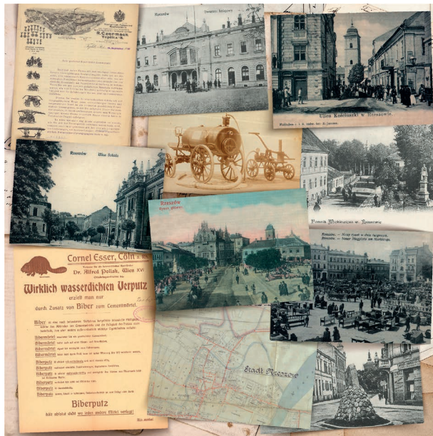
Fot. 2 – fot. Marek Gieron