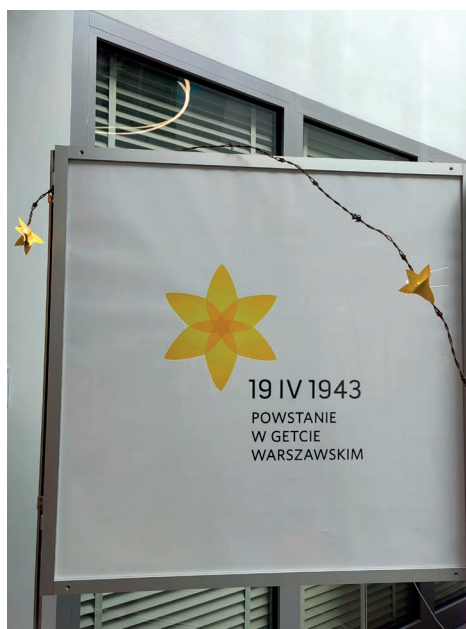
Fot. 7