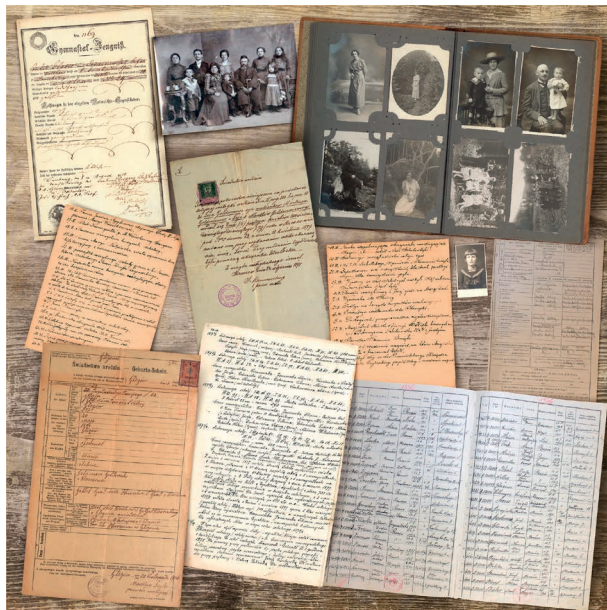
Fot. 3