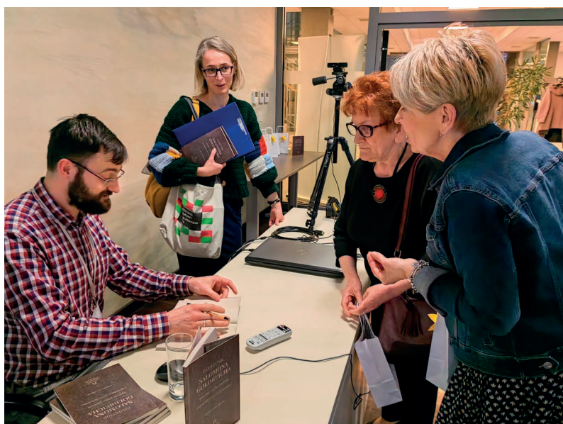
Fot. 11 – Podpisywanie egzemplarzy autorskich