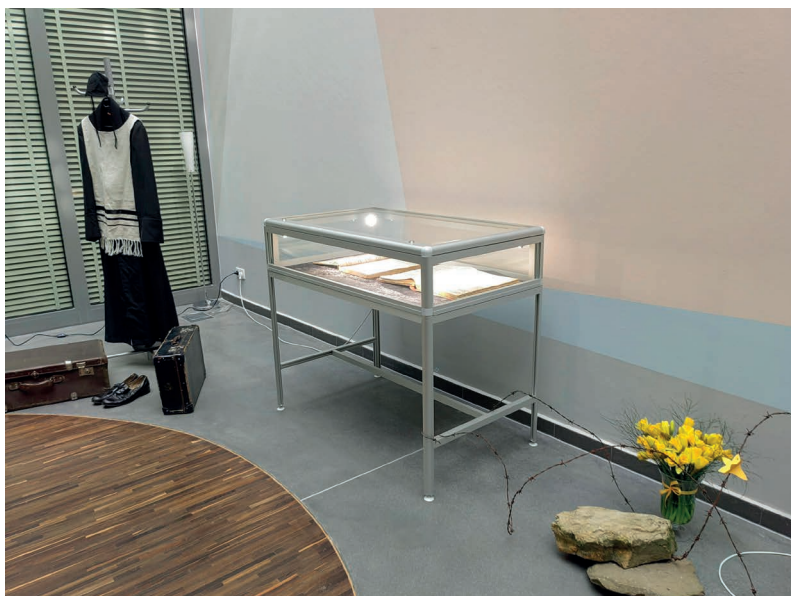
Fot. 8