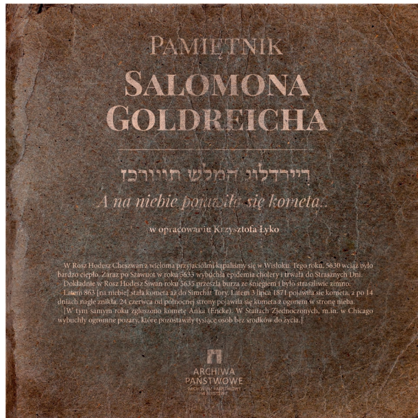
Fot. 5