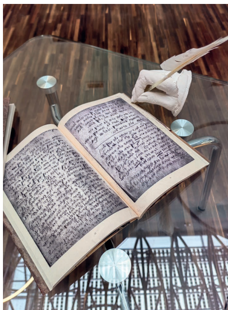
Fot. 9