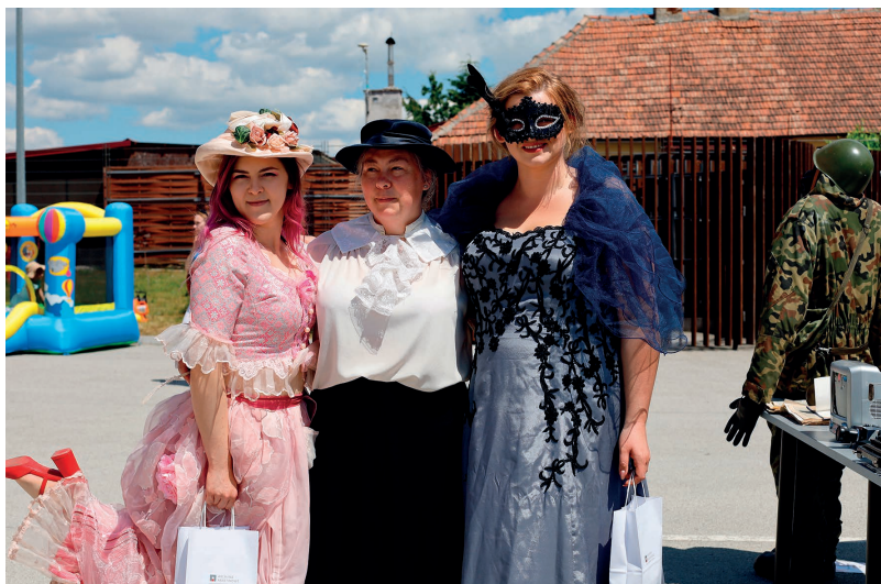
Fot. 11 – Piknik z okazji Międzynarodowego Dnia Archiwów 12.06.2022 – pracownicy Archiwum w kostiumach teatralnych