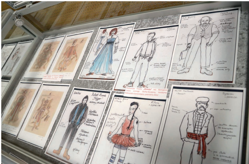
Fot. 4 – Wystawa pt. „Teatralne życie kostiumu” w Archiwum Państwowym w Rzeszowie, fot. Marek Gieroi