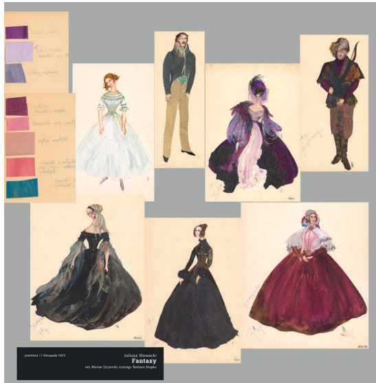
Fot. 6 – Wystawa pt. „Teatralne życie kostiumu” w Archiwum Państwowym w Rzeszowie