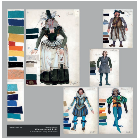
Fot. 8 – Wystawa pt. „Teatralne życie kostiumu” w Archiwum Państwowym w Rzeszowie