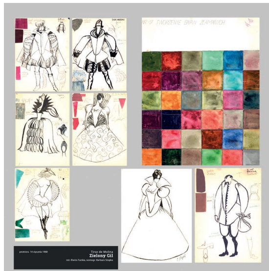
Fot. 5 – Wystawa pt. „Teatralne życie kostiumu” w Archiwum Państwowym w Rzeszowie