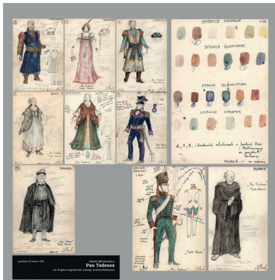
Fot. 7 – Wystawa pt. „Teatralne życie kostiumu” w Archiwum Państwowym w Rzeszowie