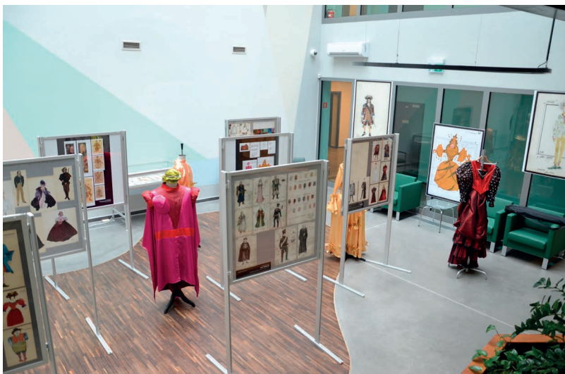
Fot. 9 – Wystawa pt. „Teatralne życie kostiumu” w Archiwum Państwowym w Rzeszowie