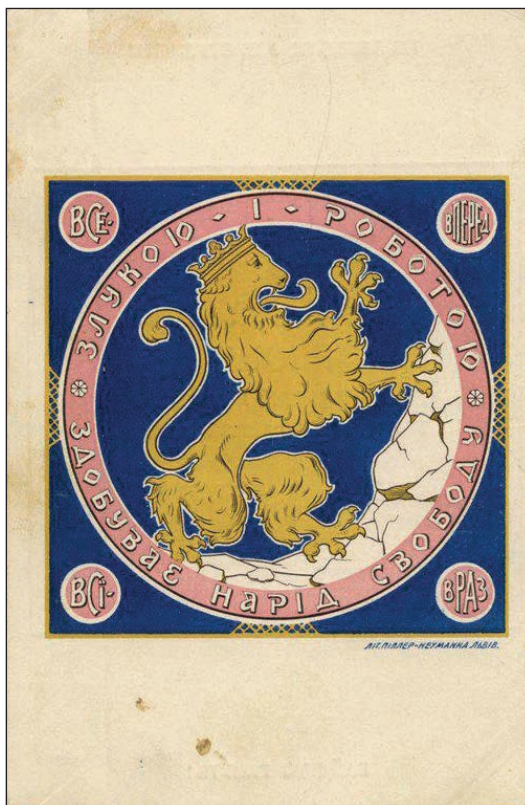
Ryc. 5. Motyw lwa z sokilskiego sztandaru wykorzystywany w materiałach propagandowych Towarzystwa.

nowego sztandaru, ale pozostało ono bez odpowiedzi. W nowym projekcie organizacyjnego proporca korekcie poddano barwę skały, na którą wspina się lew – miała ona być koloru szarego 20 .