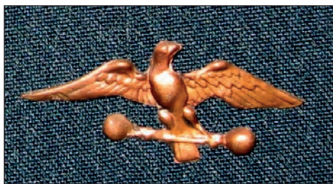
Ryc. 11. Metalowy znaczek do sokilskiej czapki – ten noszony był w latach 1895–1896. W latach późniejszych ulegał wielu modyfikacjom.