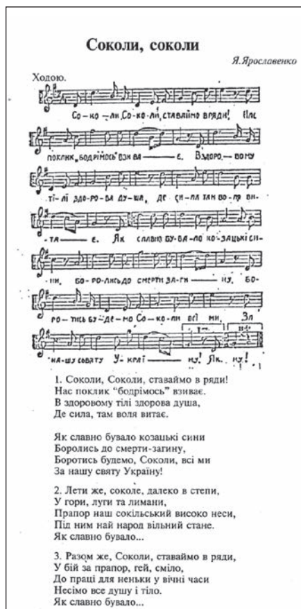
Ryc. 9. Nuty i tekst sokilskiego hymnu autorstwa Jarosława Wickowskiego (Jarosławienki).

Źródło: Sokił-Bat'ko, Sportywno-Ruchankowe Towarzystwo u Lwowi, Almanach 1894–1994,