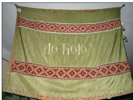
Ryc. 6 i 7. Sztandar filii „Sokiła” III we Lwowie znajdujący się w zbiorach tamtejszego Muzeum Historycznego.