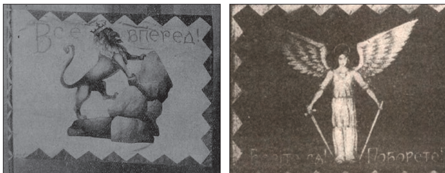
Ryc. 2 i 3. Zdjęcia oryginalnego sokilskiego sztandaru. Z jednej strony wizerunek lwa wspinającego się na skałę i słowa Wse Wpered [zdjęcie górne]. Z drugiej strony srebrnobiałych św. Michał Archanioł z mieczem i pochwą w rękach [zdjęcie dolne]. Po obu stronach postaci wyhaftowane słowa Tarasa Szewczeni: Boritesja, Poborete!