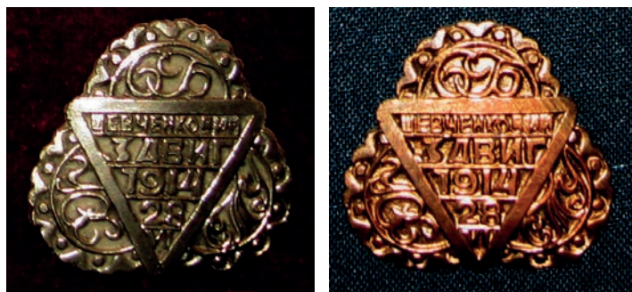
Ryc. 18 i 19. Odznaki metalowa i miedziana.

litery: „C-B” (S-B – „Sokił-Bat’ko”), „YCC” (USS – Ukraiński Siczowy Sojuz) i „CTY” (STU – Sportowe Towarzystwo „Ukraina”) – nazwy Towarzystw, które wspólnie organizowały zlot. W środku odznaki napis: „Szewczenkowski Zlot 1914, 28 VI”. Forma trójkąta miała umożliwić takie ustawienie odznaki, by Towarzystwo właściciela odznaki mogło być na górze. Wybito je w Wiedniu na koszt „Sokiła-Bat’ka” i „Związku Siczowego”; 10 000 sztuk wykonano z białego metalu, a 100 sztuk z miedzi.