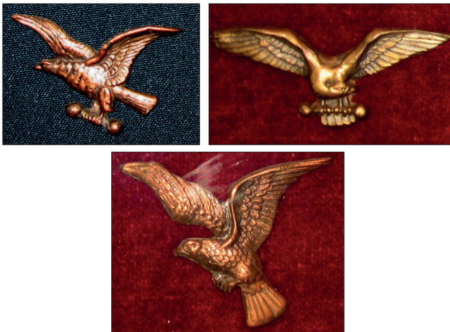
Ryc. 12, 13, 14. Odznaki do czapek.