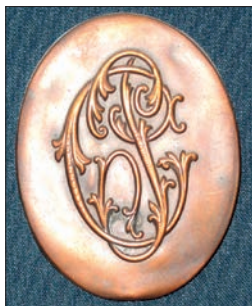
Ryc. 10. Metalowa klamra, wg projektu Mykoły Iwasiuka, do paska pierwszych strojów sokilskich z lat 1895–1896, z widocznymi literami „PC” (RS – Ruski Sokił , jak pierwotnie nazywano sokilskie Towarzystwo).