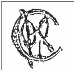
Ryc. 17. Odznaka ażurowa.