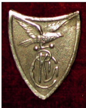
Ryc. 20. Tarcza z sokołem.