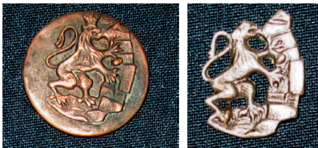
Ryc. 15 i 16. Spinka i znaczek.