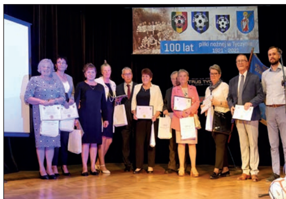
Piłkarki ręczne na 100-lecie.